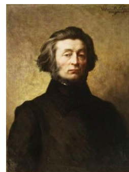
Adam Mickiewicz (1798–1855) – jeden z najwybitniejszych poetów polskich, działacz polityczny, publicysta.